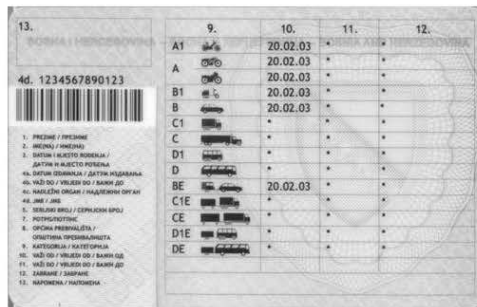
Слика 2. Задња страна возачке дозволе