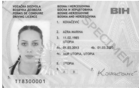
Слика 1. Предња страна возачке дозволе